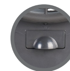
Entrada de água