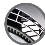
Saida da névoa