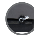
Escoamento de água do reservatório