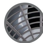
Grade de proteção