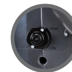
Regulagem de fluxo da névoa