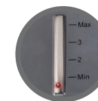
Nível de água no reservatório até 4L