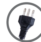
Plugue já com nova padronização brasileira