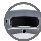
Alça para transporte